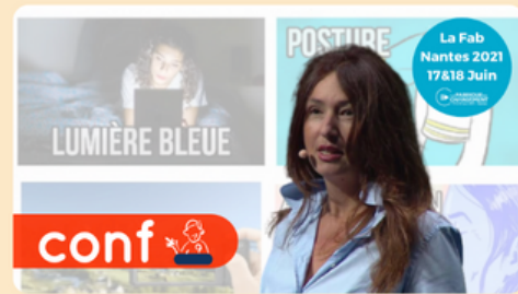
Votre nouvelle aventure : Créer et entr... 57min